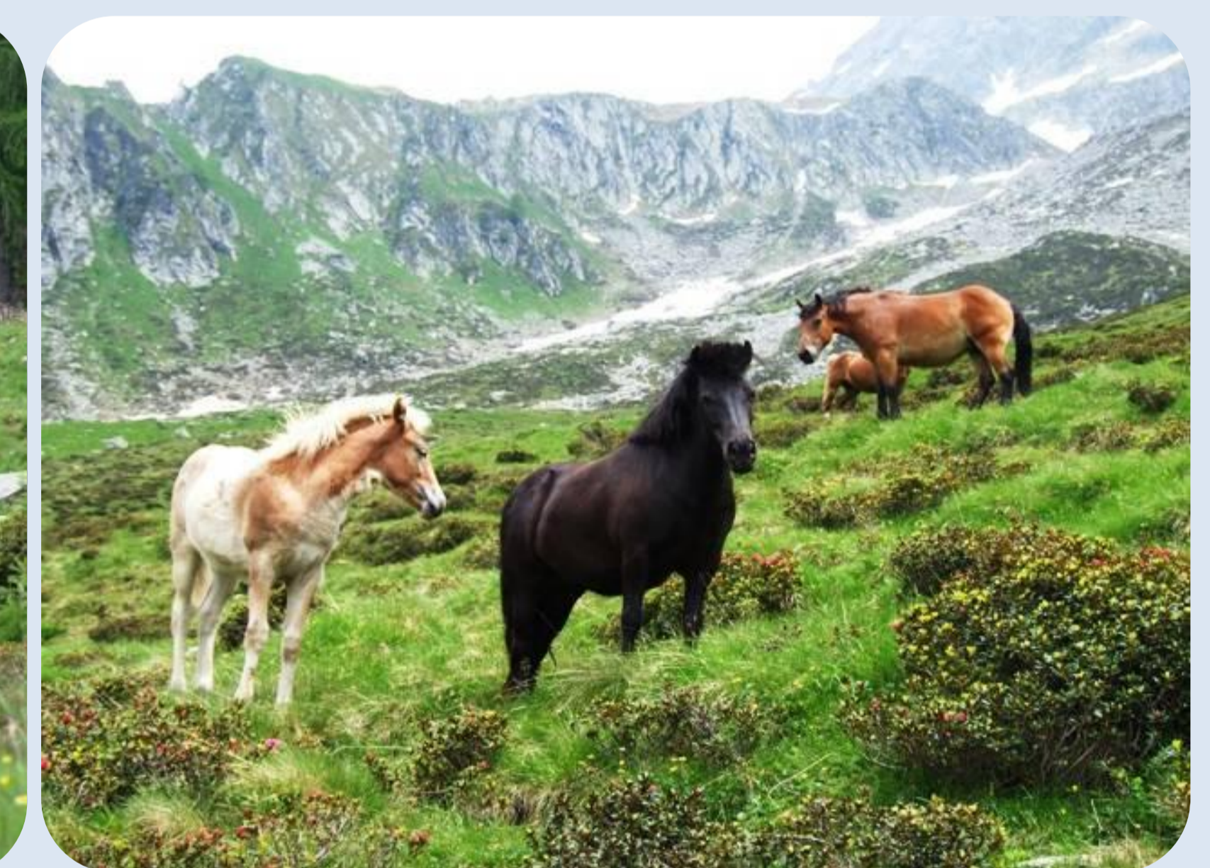
Mucche e cavalli al pascolo sui nardeti dell'Alpe Piempo

Al contempo però un esagerato carico di bestiame, o un'elevata concentrazione degli animali su superfici ristrette (generalmente quelle più pianeggianti, quindi più accessibili al bestiame), porta al deterioramento dell'habitat.